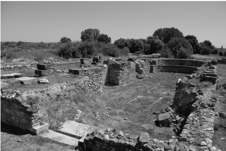
Εικόνα 2. Φωτογραφική απεικόνιση της επισκοπικής βασιλικής, στην οποία διακρίνονται και οι δύο κύριες οικοδομικές φάσεις του μνημείου (συμβατικά Βασιλική Α' και Β'), λήψη από τα βορειοδυτικά. (από: Κ. Φραγκούλης, Επισκοπική Βασιλική 107 , εικ. 27)