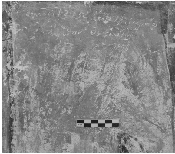
Εικόνα 3. Φωτογραφική απεικόνιση του ακιδογραφήματος, το οποίο μνημονεύει την αρχική φάση του ναού.