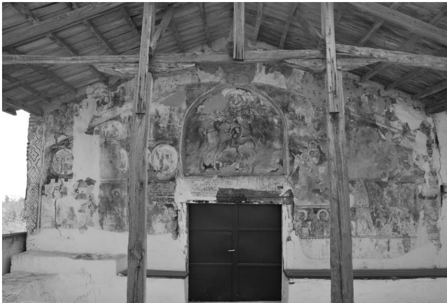
Εικόνα 4. Ο δυτικός τοίχος του ναού Αγίου Δημητρίου Μαλαθριάς με τη σκηνή της Τελικής Κρίσεως και την ανακαινιστική επιγραφή του επισκόπου Νεοφύτου.