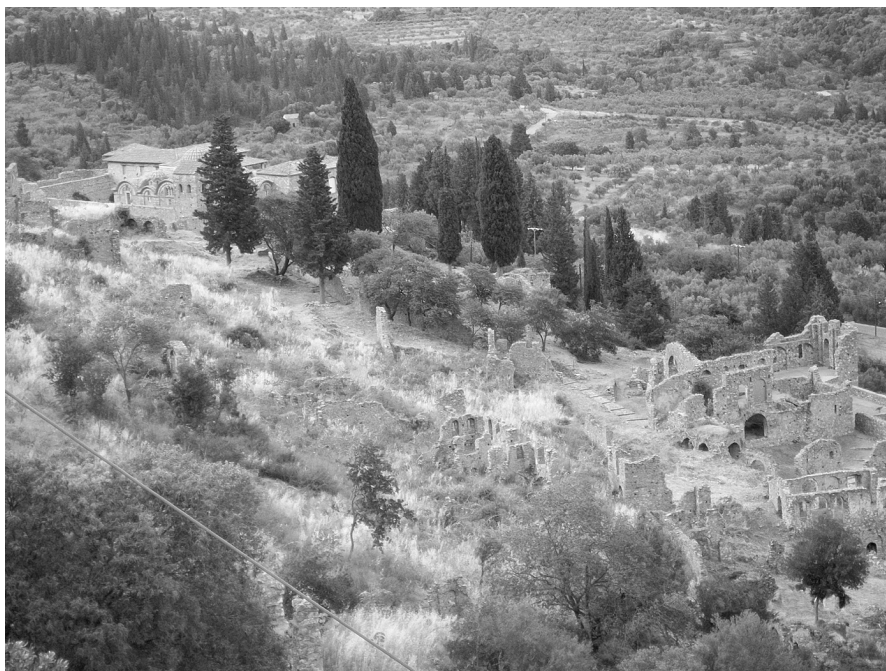
Εικόνα 1: Άποψη του αρχαιολογικού χώρου του Μυστρά. Στο αριστερό τμήμα της εικόνας διακρίνεται η Μονή Παντάνασσας [ημερομηνία φωτογραφίας: 26 Μαΐου 2010].

Περιγραφή: Ο Μυστράς, κοντά στην πόλη της Σπάρτης και δίπλα στο ομώνυμο χωριό, ήταν μια από τις σημαντικότερες βυζαντινές καστροπολιτείες (εικόνα 1).