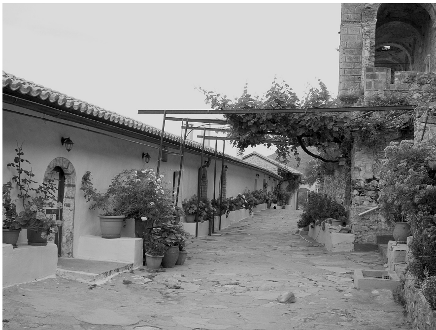
Εικόνα 3: Η εσωτερική αυλή-διάδρομος της Μονής Παντάνασσας. Στην αριστερή πλευρά της αυλής βρίσκονται τα κελιά, η τραπεζαρία, το αρχονταρίκι και ένας μικρός χώρος έκθεσης και πώλησης μικροαντικειμένων για τους προσκυνητές. Στη δεξιά πλευρά και στο βάθος της αυλής διακρίνονται οι δύο είσοδοι που συνδέουν το χώρο της Μονής απευθείας με το ναό της Παντάνασσας, ο οποίος διακρίνεται στο επάνω δεξιά τμήμα της εικόνας [ημερομηνία φωτογραφίας: 26 Μαΐου 2010].